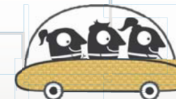
Formación de equipos