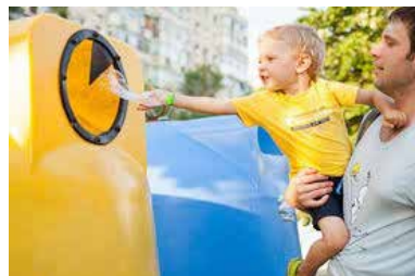
Imagen del mes