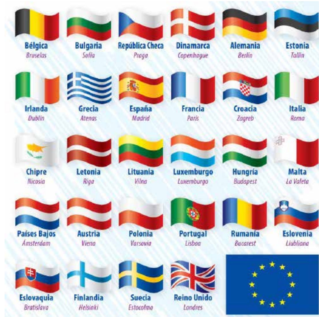
Banderas de los 28 países que conforman actualmente la Unión Europea más la propia bandera de la Unión.