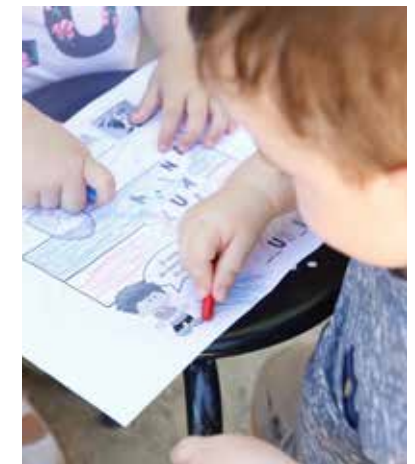
Momentos de trabajo en los talleres de las bibliotecas de verano