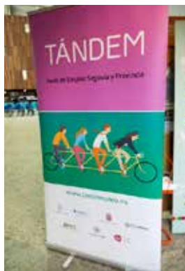
Cartel de la II Feria de empleo.

Más de 20 empresas e instituciones de la provincia de Segovia se dieron cita en el Campus María Zambrano de la Universidad de Valladolid en el evento, celebrado el 21 de abril, que recibió, además, la inesperada visita de la ministra de Empleo y Seguridad, Fátima Báñez.