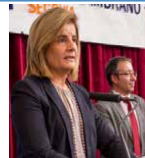
La ministra de Empleo, Fátima Báñez.

http://www.tandempleo.es/ facebook: Tandempleo http://www.europedirectsegovia.com