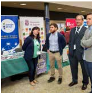
Un momento de la feria 'Tandem'.

El Ayuntamiento de Segovia, a través de la concejalía de Desarrollo Económico, Empleo e Innovación, la Diputación de Segovia, la Federación Empresarial Segoviana (FES), la Asociación de Jóvenes Empresarios, y el Parque Científico de la UVA organizaron el principal evento relacionado con el empleo que tiene lugar en Segovia, una cita en la que también colaboró el Servicio Público de Empleo de la región.