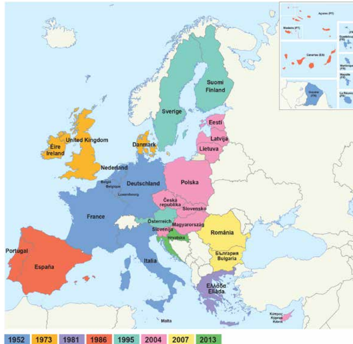
Mapa de Europa con las distintas ampliaciones que ha sufrido la Unión Europea hasta el año 2013.