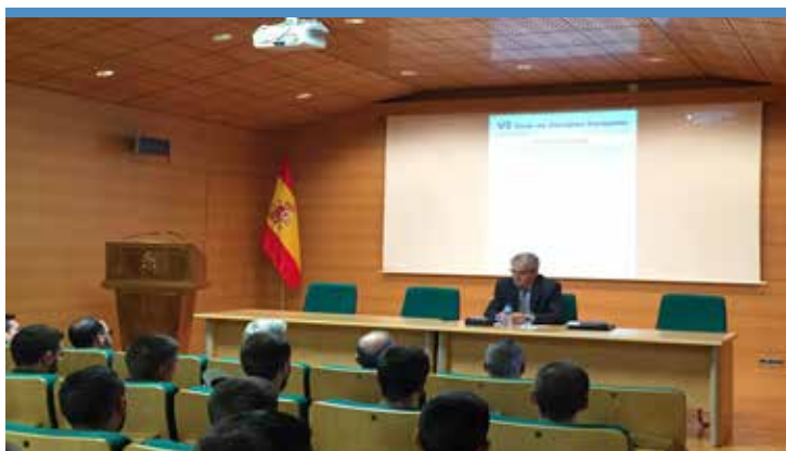
Alfonso Dastis Quecedo en la última de las 5 conferencias del VI Ciclo de Estudios Europeos.