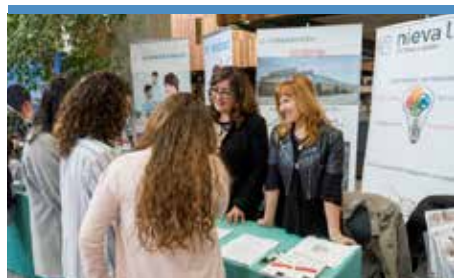
Uno de los 20 stands que ofrecían empleo en Segovia.

Más de 20 empresas e instituciones de la provincia de Segovia se dieron cita en el Campus María Zambrano de la Universidad de Valladolid en el evento, celebrado el 21 de abril, que recibió, además, la inesperada visita de la ministra de Empleo y Seguridad, Fátima Báñez.