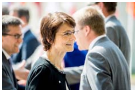
Marianne Thyssen, Comisaria de Empleo, Asuntos Sociales, Capacidades y Movilidad Laboral

Marianne Thyssen, Comisaria de Empleo, Asuntos Sociales, Capacidades y Movilidad Laboral, ha manifestado: «Acojo con satisfacción la adopción de este programa por valor de más de 1 000 millones de euros para España. Está diseñado para ayudar a las